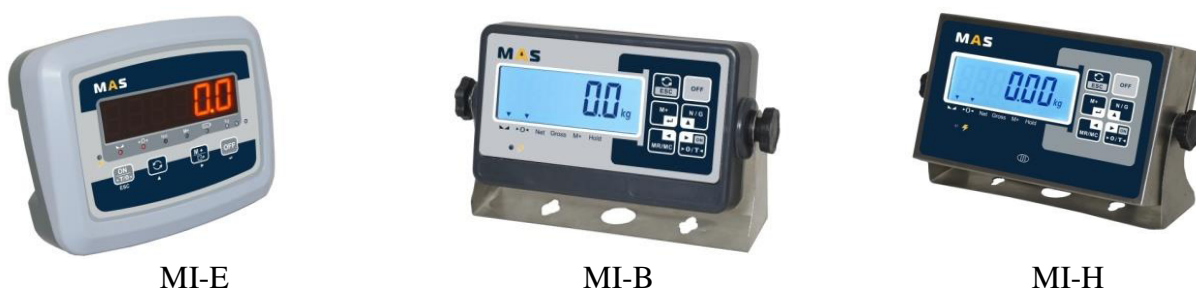
Рисунок 2 – Общий вид индикаторов