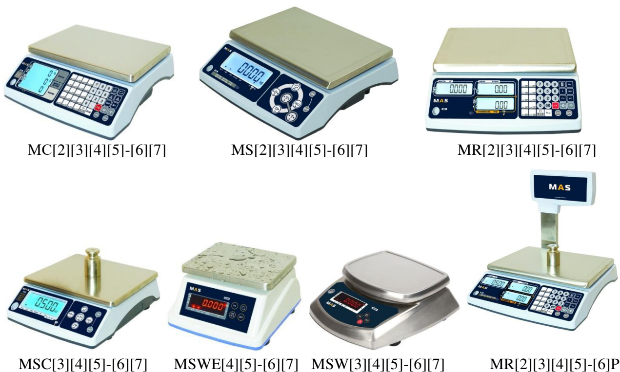
Рисунок 1 – Общий вид модификаций весов

Схема пломбировки от несанкционированного доступа представлена на рисунке 2.