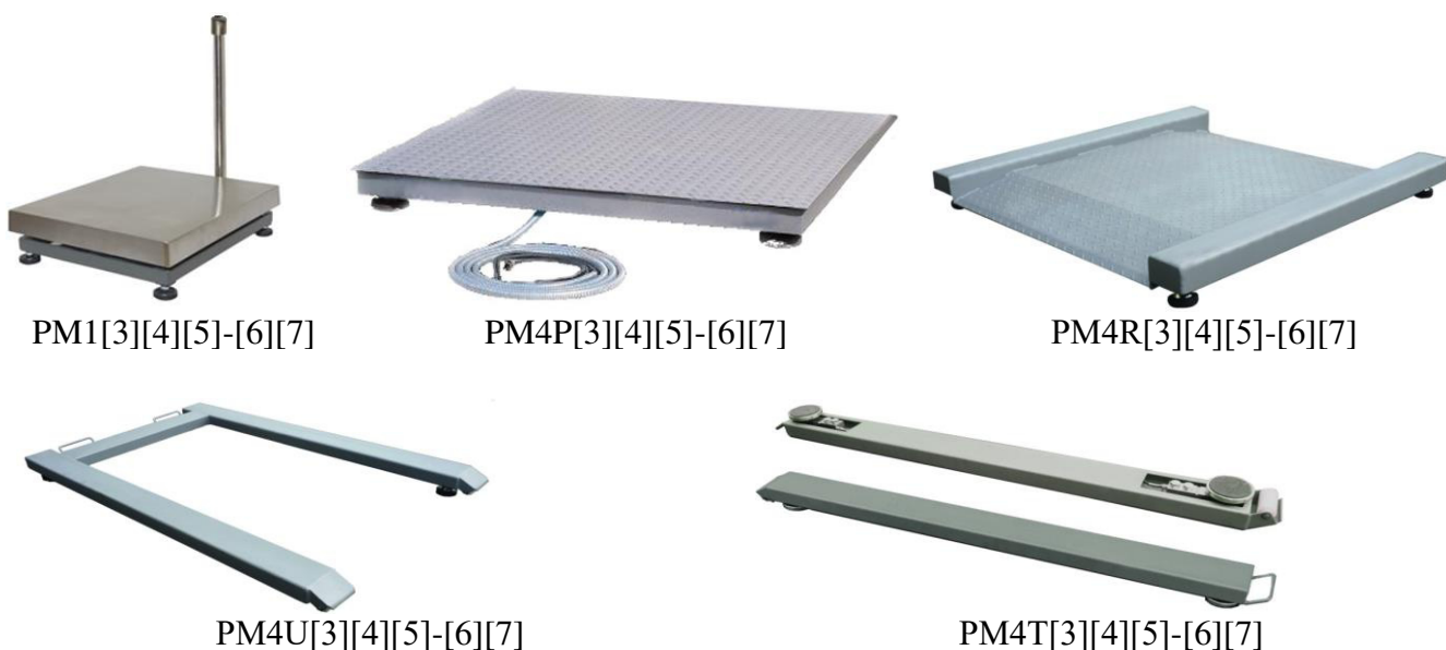
Рисунок 1 – Общий вид ГПУ весов

Схема пломбировки от несанкционированного доступа, обозначение места нанесения знака поверки представлены на рисунке 3.